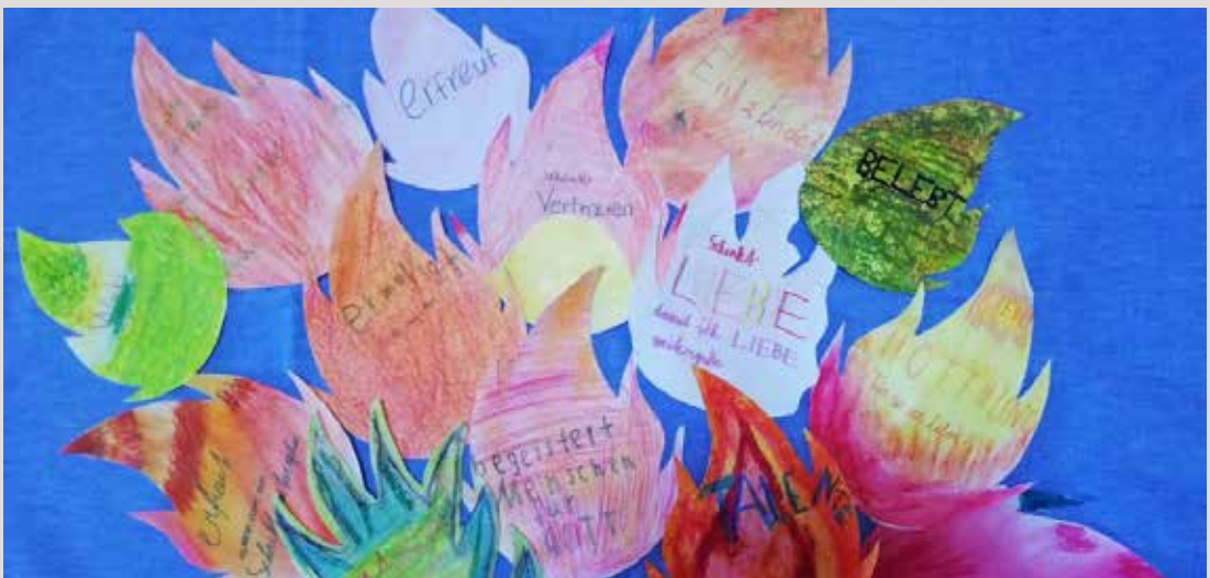
Gottes Geistkraft – 3. Volksschulklasse Sulzberg