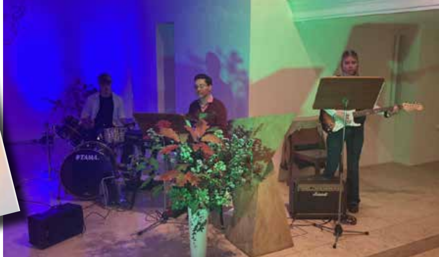
Gottes Geist auf der Spur mit Worten aus der Bibel, in einer Kirche in blauem Licht, mit Musik und Tanz im Gottesdienst mal anders am 21. Oktober 2022.

Herzliche Einladung zu den nächsten Gottesdiensten mal anders am 17. Februar und am 16. Juni wie immer am Freitag um 18 Uhr in der Christi-Himmelfahrts-Kirche!