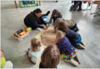
Kigo Arche Noah im März