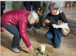
Emmausgang am Ostermontag