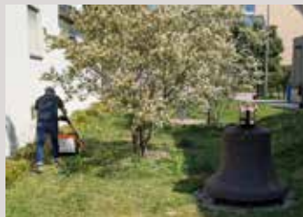
Gartenaktion CHK im April