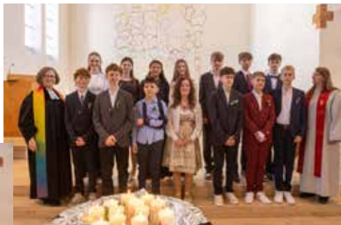
Am Samstag 2. Mai und Sonntag, 3. Mai feierten 42 Jugendliche aus unserer Gemeinde ihre Konfirmation.

"Ich will dich segnen und du sollst ein Segen sein." Drei festliche Gottesdienste mit viel Musik waren i-Tüpfelchen und Ausrufezeichen nach der Vorbereitungszeit für diesen Schritt in die Verantwortung für das eigene Leben und den eigenen Glauben.