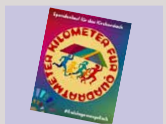
Spendenlauf fürs Dach