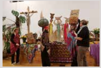
Weltgebetstag Zolling im März