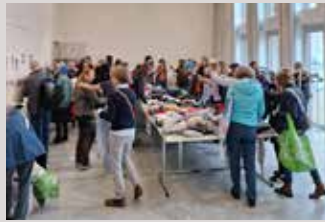
Kleidertauschparty im März