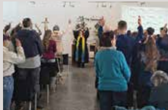
Ostersonntag im EPI