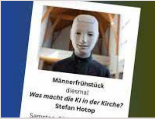
Männerfrühstück im Februar