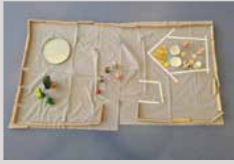
KITA-Andacht im Februar