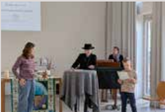
Kigo am Karfreitag