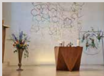
CHK geschmückt für die Konfirmation